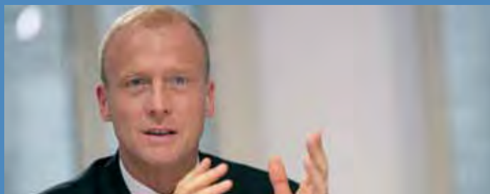
Thomas Enders Chief Executive Officer (CEO)

Thomas Enders kam 1991 zu MBB/Dasa. Nach mehrjähriger Tätigkeit im Marketingbereich wurde er 1995 zum Corporate Secretary der Dasa AG ernannt. Von 1996 bis 2000 leitete er den Bereich Konzernstrategie und Technologie der Dasa, anschließend den Geschäftsbereich Verteidigungs- und Sicherheitssysteme der EADS. Im Juni 2005 folgte seine Ernennung als Chief Executive Officer des EADS-Konzerns. Dr. rer. pol. Thomas Enders besitzt Abschlüsse der Universität Bonn sowie der University of California, Los Angeles.