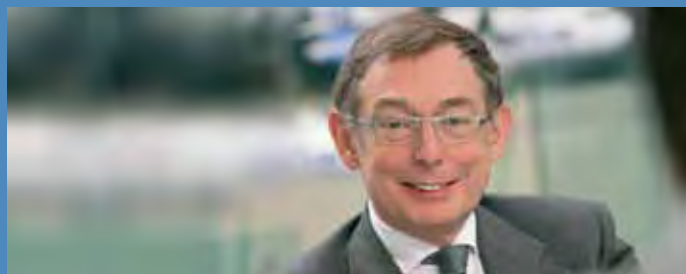
Noël Forgeard Chief Executive Officer (CEO)

Thomas Enders kam 1991 zu MBB/Dasa. Nach mehrjähriger Tätigkeit im Marketingbereich wurde er 1995 zum Corporate Secretary der Dasa AG ernannt. Von 1996 bis 2000 leitete er den Bereich Konzernstrategie und Technologie der Dasa, anschließend den Geschäftsbereich Verteidigungs- und Sicherheitssysteme der EADS. Im Juni 2005 folgte seine Ernennung als Chief Executive Officer des EADS-Konzerns. Dr. rer. pol. Thomas Enders besitzt Abschlüsse der Universität Bonn sowie der University of California, Los Angeles.