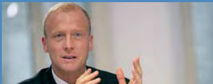
Thomas Enders Consejero Delegado

El Sr. Enders ingresó en MBB/Dasa en 1991. Tras varios años en el sector comercial de la compañía, fue nombrado Secretario General de Dasa AG en 1995. A partir de 1996 estuvo a cargo de Estrategia Corporativa y Tecnología y, desde el año 2000, fue Director de la División Defensa y Sistemas de Seguridad. En junio de 2005 fue nombrado Consejero Delegado de EADS. El Sr. Enders es licenciado por las Universidades de Bonn y UCLA, California.