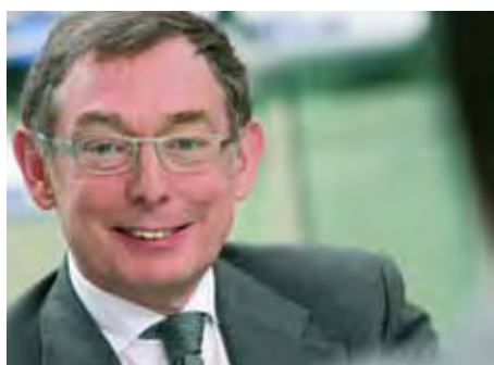
Noël Forgeard Président exécutif